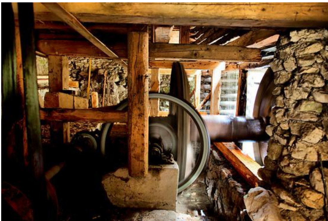
Obrázok 4 Pohľad na funkčný mlyn z vnútra