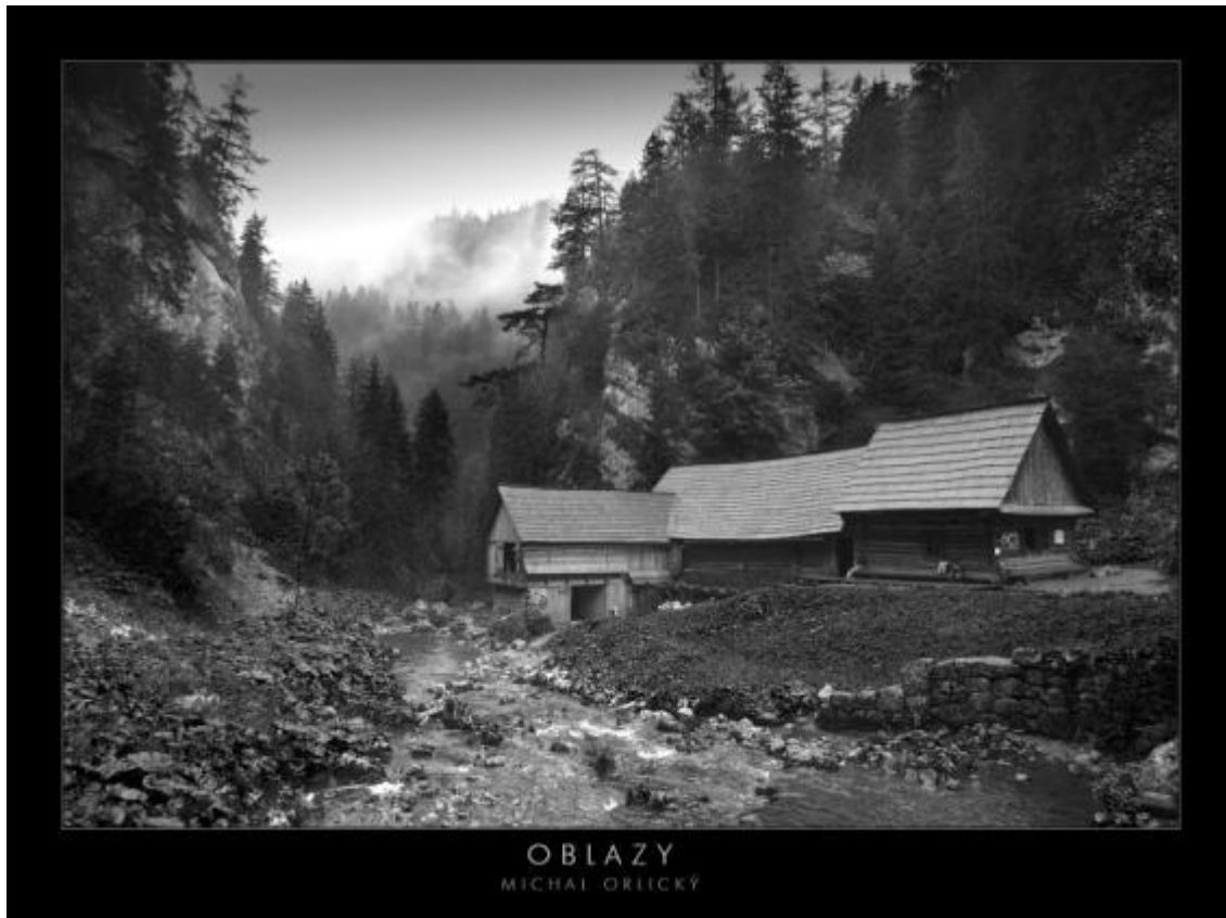
Obrázok 3 Mlyny Oblazy