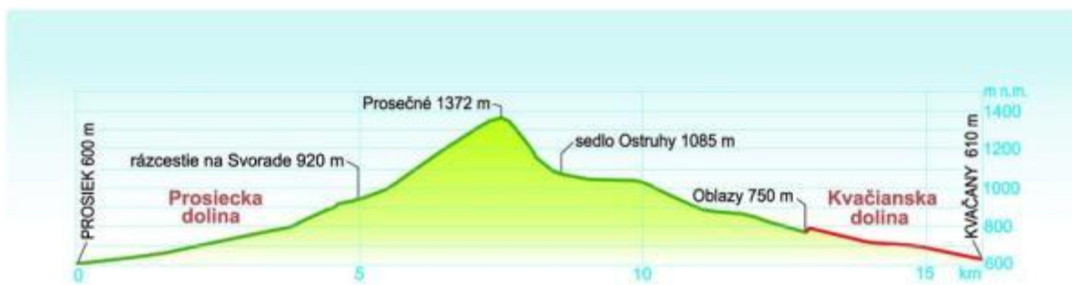
Obrázok 2 Profil turistického chodníka Kvačianska dolina – Prosiecka dolina