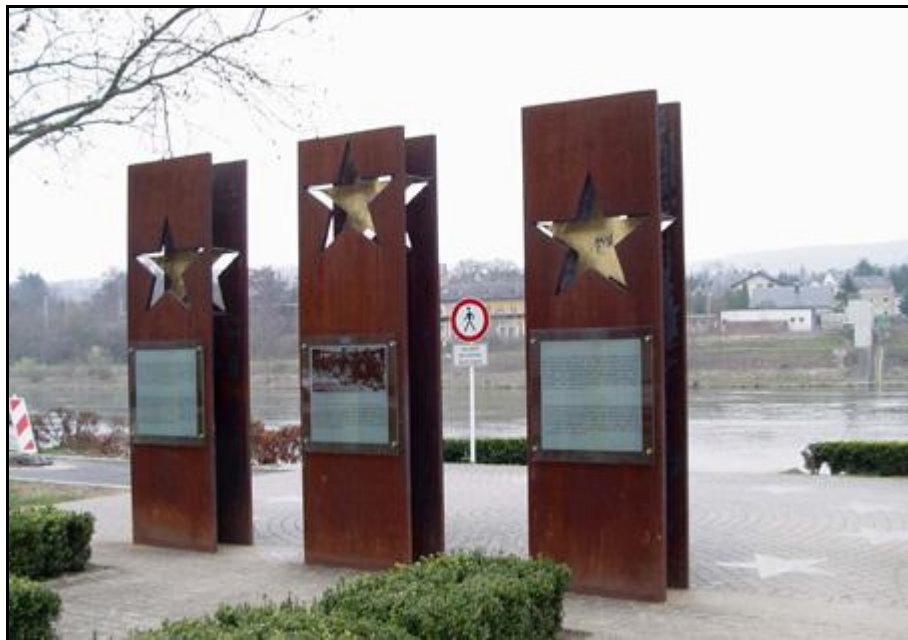
Obrázok 1 Pamätník Schengenu v meste Schengen, Luxembursko