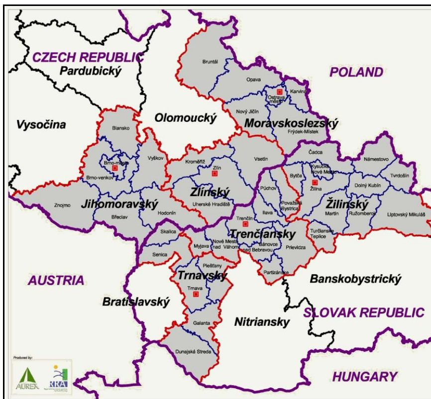
Obrázok 2 Geografické vymedzenie INTERREG IIIA SR-ČR