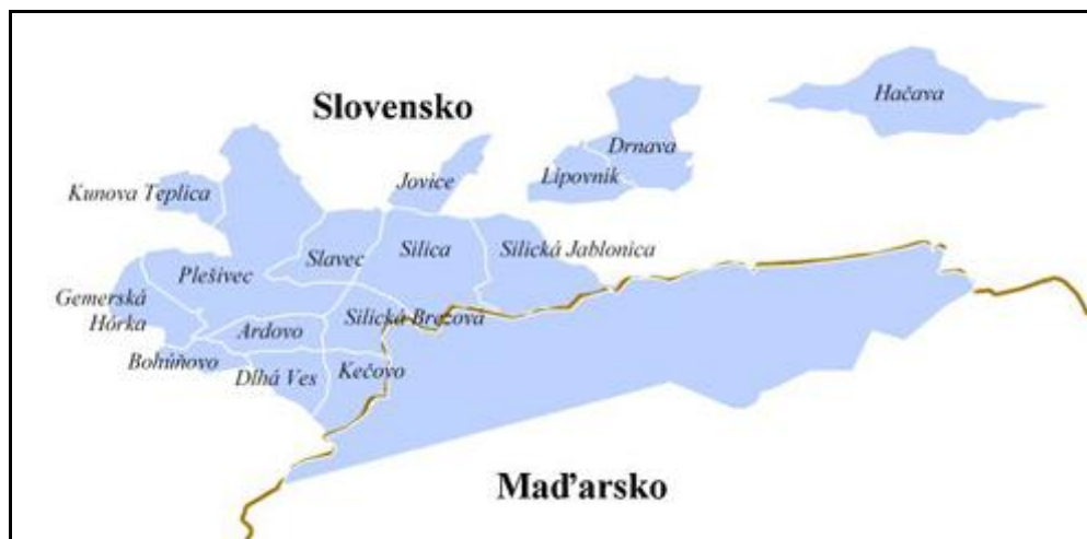
Obrázok 3 Geografické vymedzenie euroregiónu Kras

Zdroj: < http://www.minv.sk/?euroregion-kras > [2012].