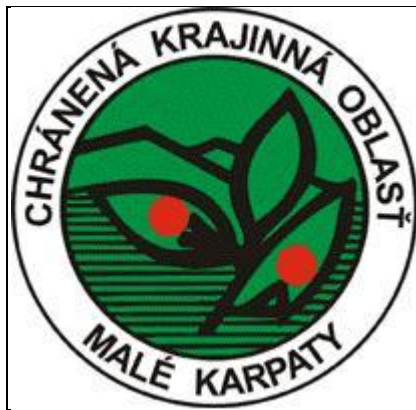
Obrázok 1 Symbol chránenej krajinnej oblasti