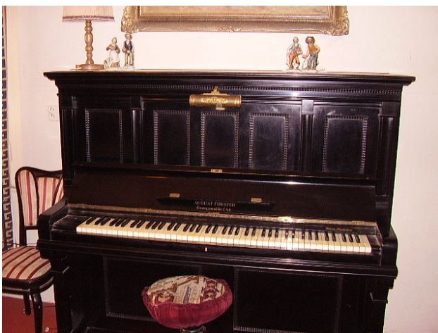
Obr. 5 - pozostalost' po Ladislavovi Dierovi – klavír z obdobia 1.ČSR (Budínska)