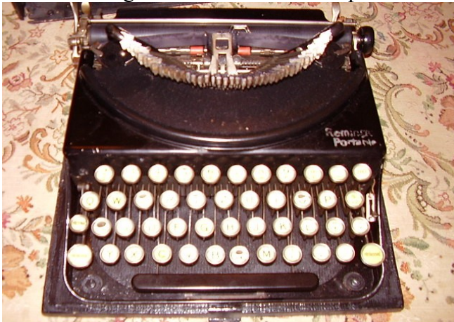
Obr. 4 - pozostalost' po Ladislavovi Dierovi - písací stroj (Budínska)