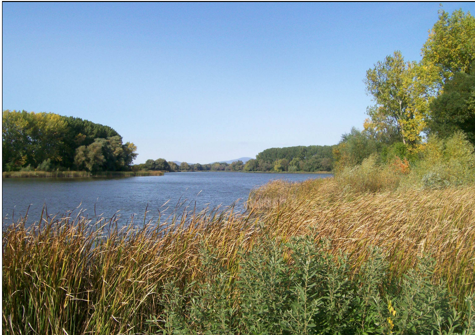
Obrázok 1 Vrábeľská vodná nádrž