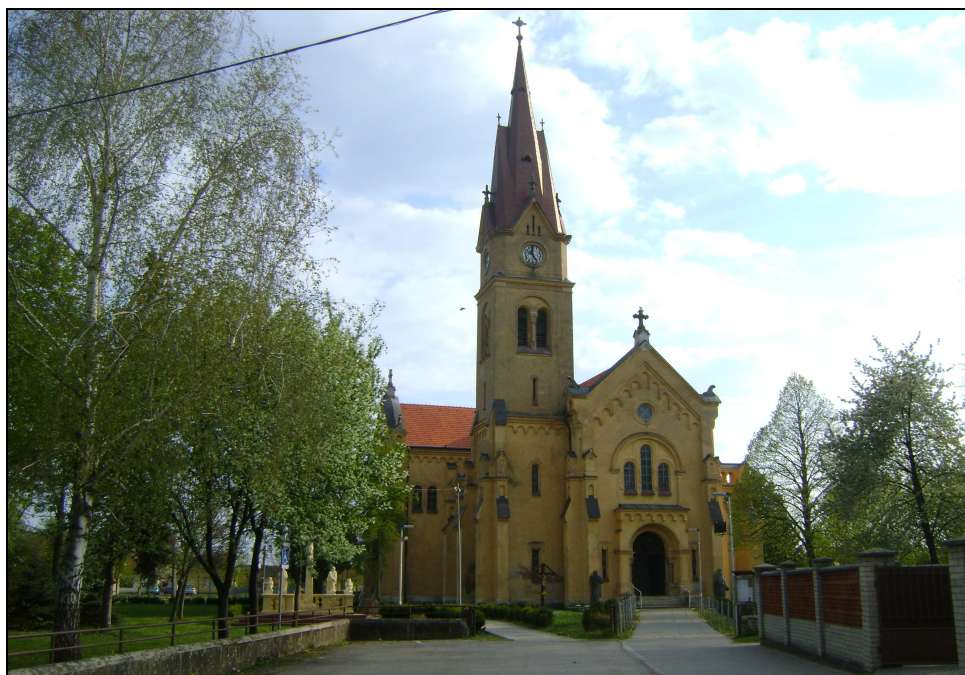
Obrázok 3 Rímsko-katolícky kostol Preblahoslavenej Panny Márie

pamiatkového objektu. 49 Budova kostola je trojlod'ová bazilika postavená v neorománskom slohu. Medzi najvzácnejšie sochy patrí socha Sedembolestnej Panny Márie ktorá pochádza z 18. storočia. 50