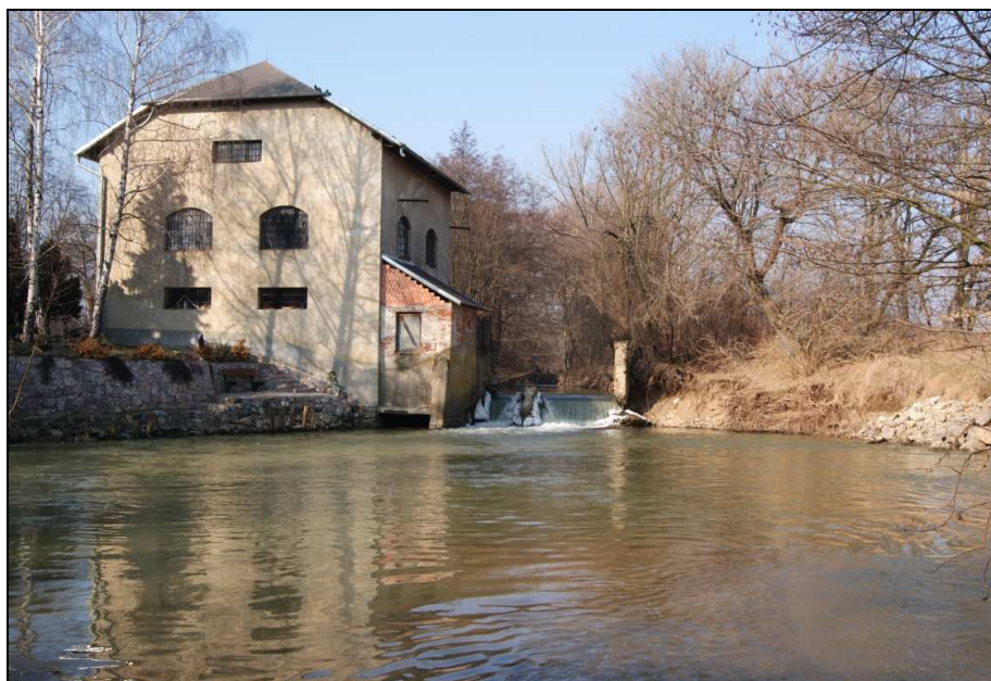
Obrázok 6 Požitavské múzeum mlynárstva

nivy, kde nezregulovaný tok rieky vytvára prírodné meandre a tiché zákutia. História mlynov na Žitave siaha do hĺbky niekoľkých storočí. Budova Mašekovho Mlyna dnes poskytuje vhodné priestory na stretnutia priateľov pôvodného vidieckeho štýlu života a všetkých ekologicky orientovaných ľudí so záujmom o trvalo udržateľný rozvoj. V roku 1319 sa na mieste farmy spomína starý drevený vodný mlyn, ktorý mlel pre ostrihomskeho arcibiskupa kvalitnú múku. Rodina Demešovcov ktorá mlyn odkúpila, po dohode s občianskym združením Fontis v auguste 2004 začala svojpomocne budovať živý agrárny skanzen - Požitavské múzeum mlynárstva. Mašekov mlyn ponúka víkendové oboznamovacie kurzy pre rodiny s deťmi, alebo malé kolektívy pre všetky vekové kategórie. Ako doplnkový šport ponúka možnosť rybolovu, cykloturistiku, návštevu vnútorného areálu mlyna spojenú s prehliadkou zvierat chovaných na hospodárskych dvorov. Prehliadka môže byť obohatená o ochutnávku domácich špecialít, ukážku tradičných remesiel. Taktiež je tu možnosť opekania si na ohni a realizácie hier v peknom prírodnom prostredí. 60