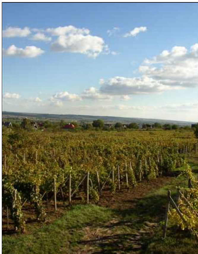
Obrázok 7 Vrábeľské vinohrady

Tradičný vrábeľský odev sa u žien sa skladal z dlhej sukne skoro po členky, skladanej na široké sklady, ktoré na páse končili v golieri, nazberané do drobných „rancov“ ako stlačená harmonika. Ku kroju patrili rukávce, pruclík na háčiky, na krk a cez prsia prekrížený ozdobný ručník uviazaný vzadu na krížoch. Na nohách nosili čižmy. 66 Muži nosili biele košele so stojatým golierom ktoré na prsiach boli vyzámikované. Gombíky boli cvernové a rukávy boli stiahnuté do úzkej manžety. Vesty z čiernej látky boli šité až ku krku a neskôr mali väčší výstrih. Kabát mal dvojradové zapínanie a čierne priliehavé nohavice mali zo súkna. 67