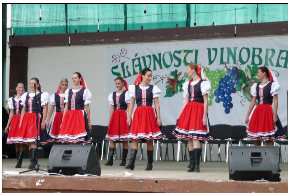
Obrázok 8 Slávnosti vinobrania