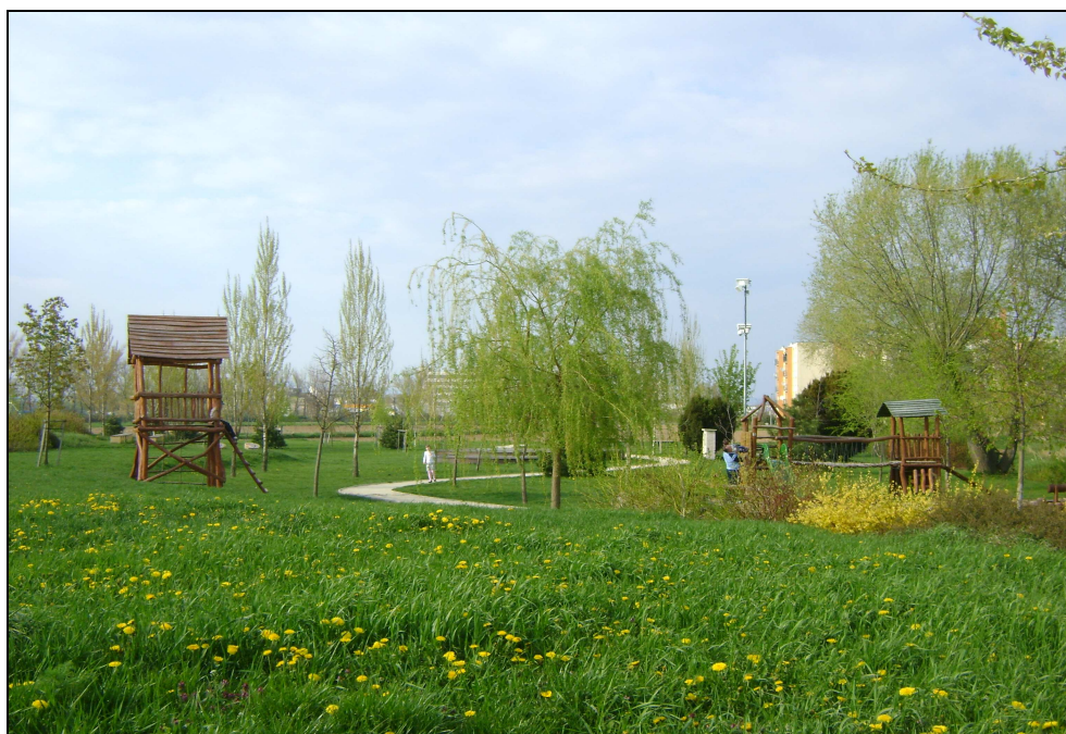
Obrázok 2 Park Žitava

Veľký význam pre rozvoj cestovného ruchu má aj Park Žitava. Občianske združenie Žitavská komunita od mája 2003 začalo pracovať na realizácii projektu relaxačnej zóny na sídlisku Žitava vo Vrábľoch. Realizácia projektu zonálneho Parku Žitava prebiehala v úzkej súčinnosti s Mestom Vráble, ktoré je vlastníkom pozemku. V priebehu výstavby bolo vysadených 1137 kusov krovitých drevín 89 ks kontajnerových stromov. Vybudované boli dve ohniská s lavičkami a drevená šindľová studňa. V roku 2006 tu bolo vybudované pódium s lavičkami, ktoré slúži najmä v letných mesiacoch na organizovanie rôznych hudobných podujatí. Taktiež boli zakúpené a osadené v odpadové koše a nové lavičky. Vybudovaný bol aj asfaltový chodník a stožiarové elektrické osvetlenie. V roku 2008 pribudol ďalší významný prvok drobnej architektúry – Detské ihrisko „Zemný hrad“. Park Žitava je vo veľkej miere využívaný miestnym obyvateľstvom na aktívny oddych a relaxáciu. 34