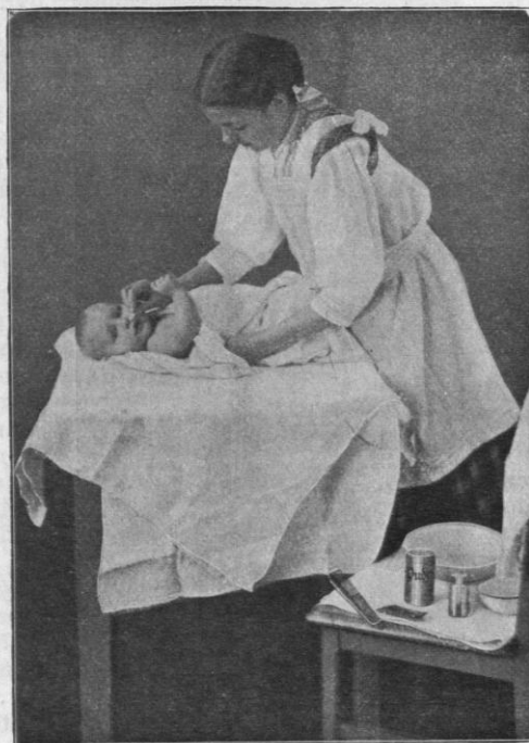
Ako má staršia sestrička čistíť svojmu malému bračekovi noštek.

Ženy, požehnané deťmi, nepotrebnú vyhľadávajú zamestnanie v prázdnych hodinách, venujú sa čím najviac výchove týchto útlých stvorení po stránke duševnej i telesnej! A. V.