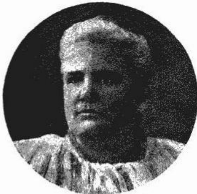
Rev. Anna Howard Shaw, předsedkyně americké Ligy pro volební právo žen.

V úterý 10. bylo dopoledne věnováno prohlídce Prahy, v poledne byl společný oběd v „Domácnosti“, po něm projížďka Královskou Oborou a na to byl podáván čaj v Ženském klubu; večer pak byli hosté přítomni představení „Prodané nevěsty“ v Národním divadle. — Ve středu ráno odjízděly kongresistky do Vídně.