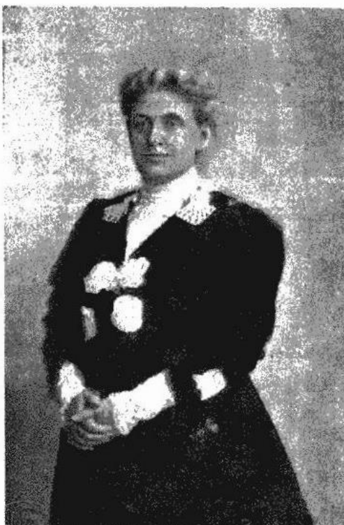
Carrie Chapman Catt, presidentka mezinárodní Alliance pro volební právo žen.

v krátkém čase posledních 2 let dostalo se volebního práva žen v šesti státech amerických, v Portugálsku a Číně. Tím rozmnoženy o 8 státy, jež mají porozumění pro občanskou svobodu člověka — a to čtyři státy severoamerické, Austrálie, Finsko a Norsko. — Čechy honosí se tím, že mají nejstarší volební právo ženské na celém světě, a to již od r. 1861. Práva toho přestalo se na dlouho užívat, až teprve zase v novější