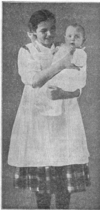
Ako má staršia sestrička—varovkyňa držať svojho malého bračeka.

Ak nemáme vôľu sadnúť si k práci, vyžadujúcej