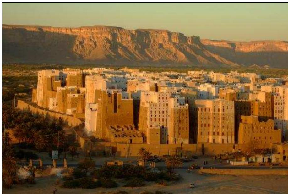
Obrázok 5 Shibam