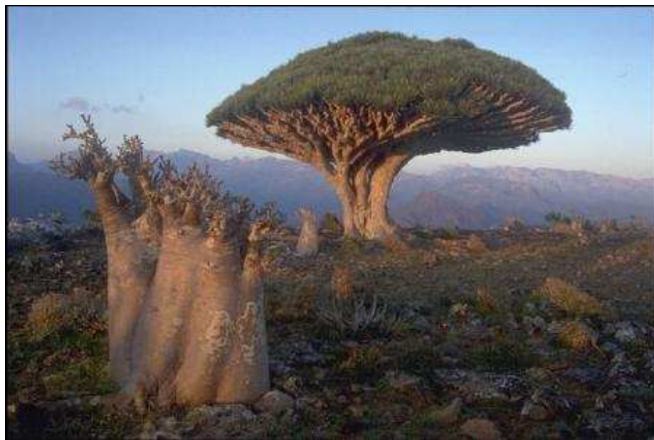
Obrázok 6 Socotra