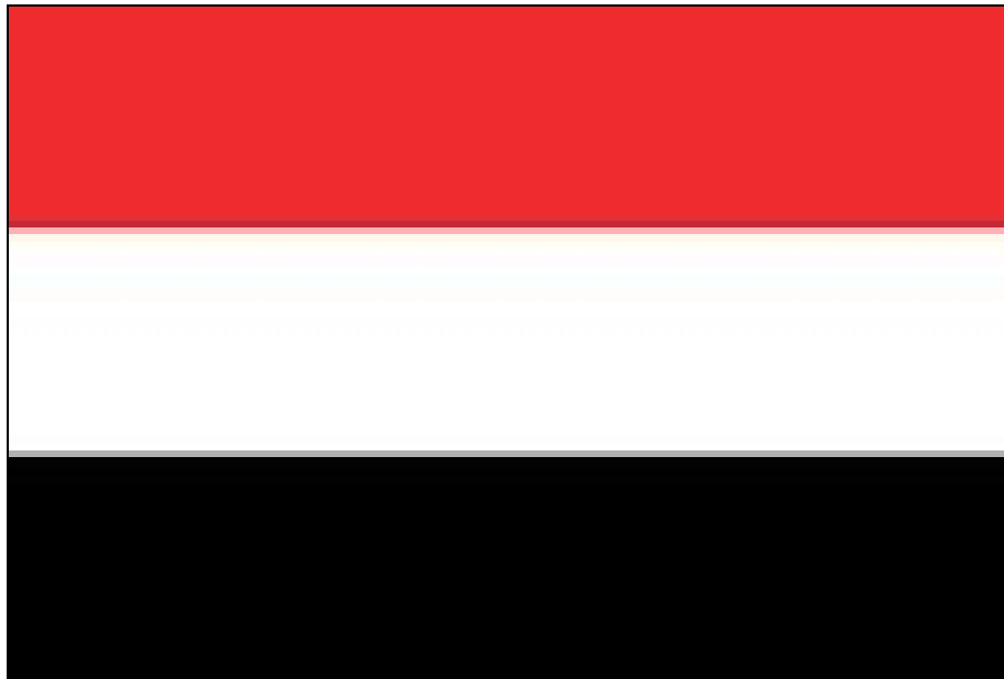
Obrázok 1 Vlajka Jemenu