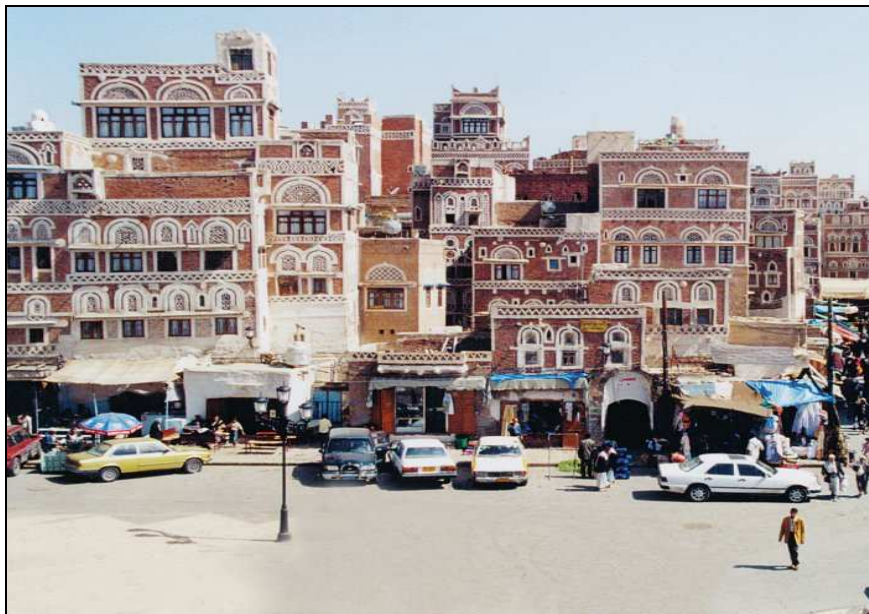
Obrázok 3 San'á