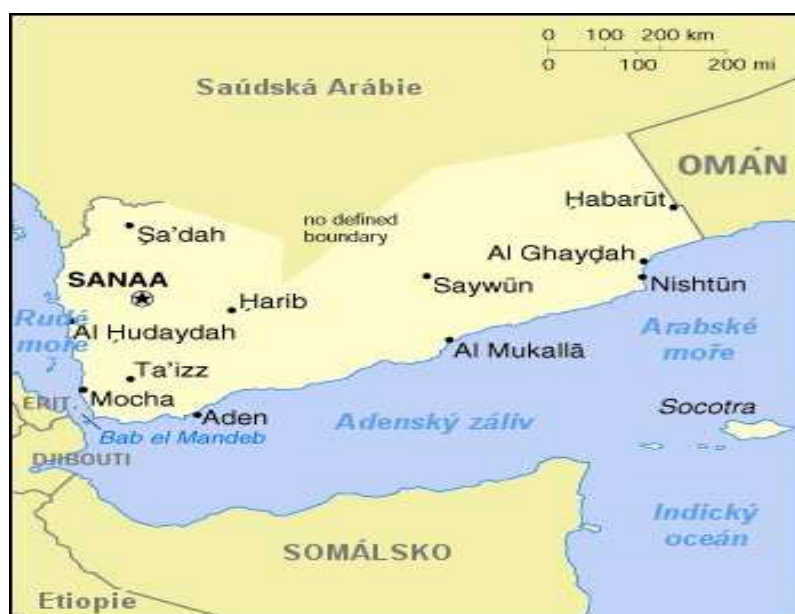
Obrázok 2 Mapa Jemenu